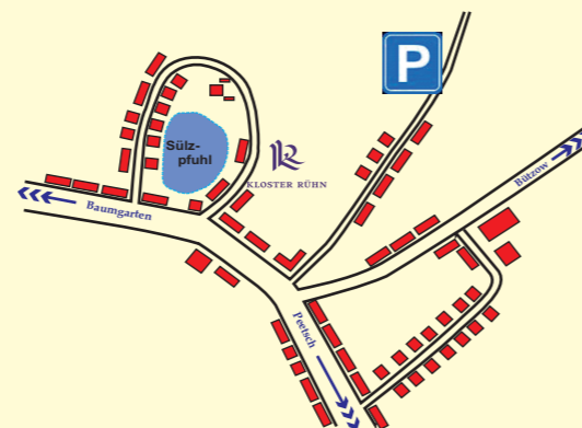
Karte zum Kloster Rühn